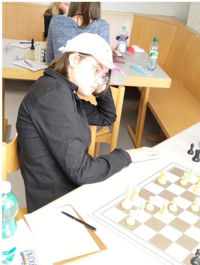
Nachdenken kann helfen beim Schach, wird immer wieder behauptet.