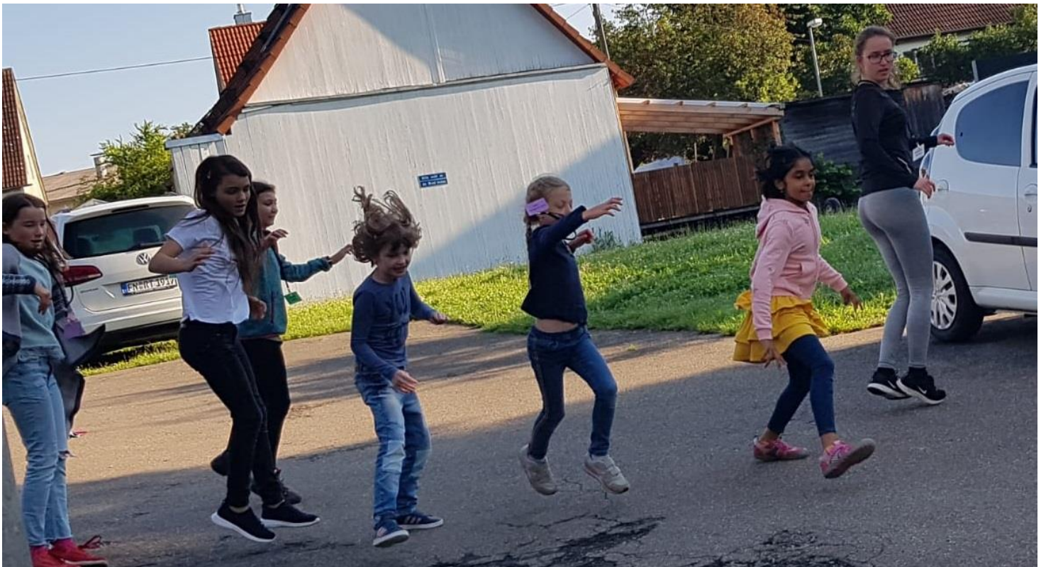
Das sieht aus wie Frühsport auf der Suche nach Frühstück.