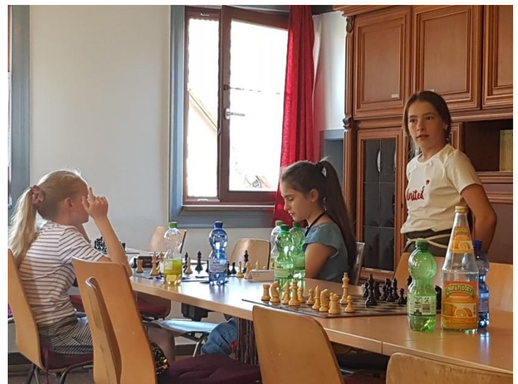
Blick in den Turniersaal der U12w in Hausen.