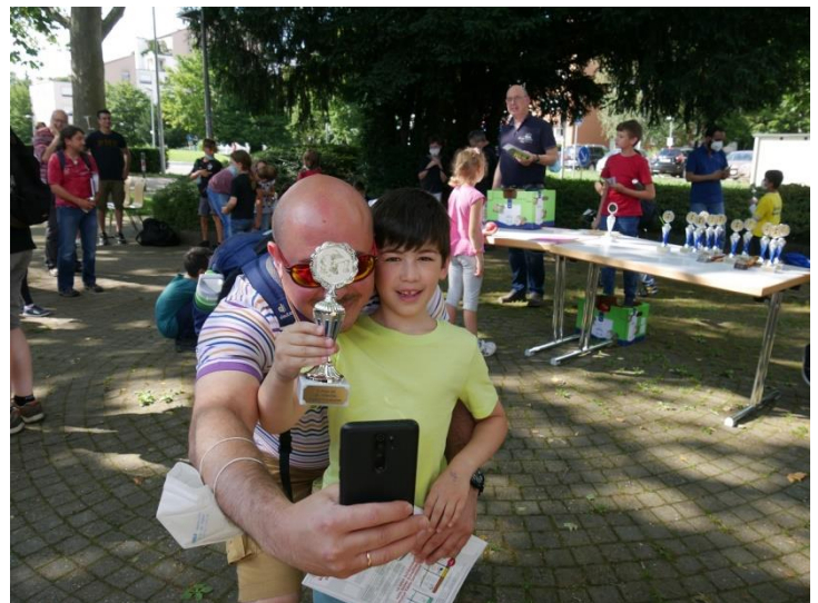
Der stolze Vater!