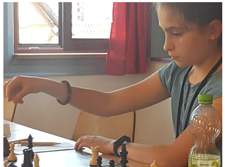
U12w in Hausen. Gute Spionagesoftware könnte vielleicht auf den Partieformularen ablesen wer spielt?