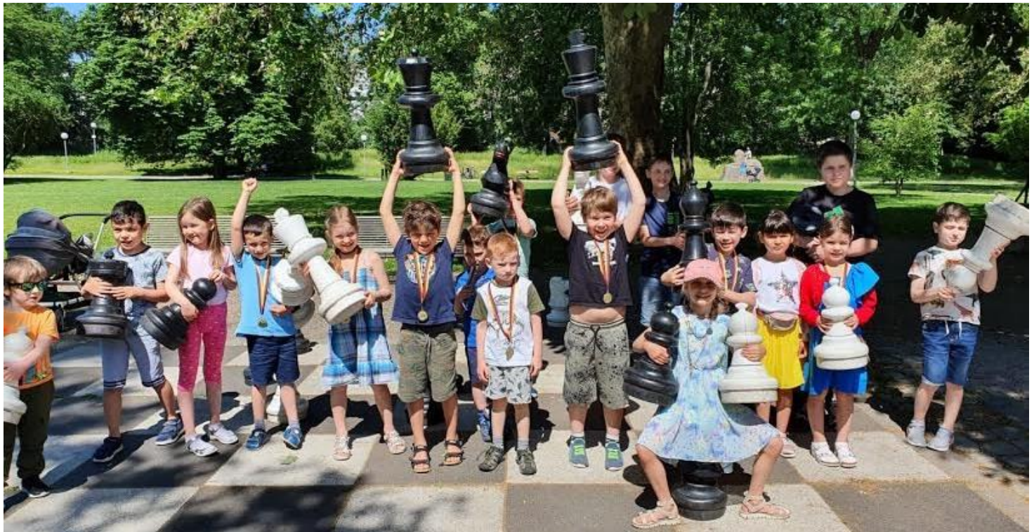
Gemeinsam Schachspielen, ob online oder draußen.

Texte und Fotos von Petra Bail (Monatsschrift „Gablberg, Ihr Stadtteil aktuell“)