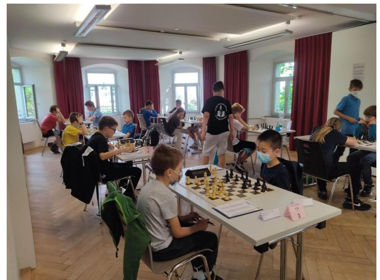
Blick in den Turniersaal in der Jugendherberge Rottweil. In der linken Reihe spielt die U10, in der Rechten die U12.