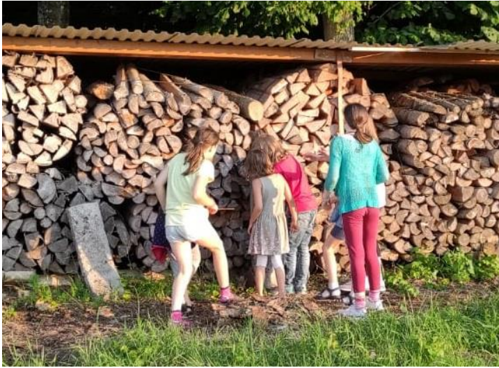
Einige sind immer noch beim Geländespiel.